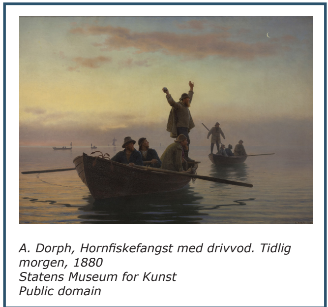
A. Dorph, Hornfiskefangst med drivvod. Tidlig morgen, 1880