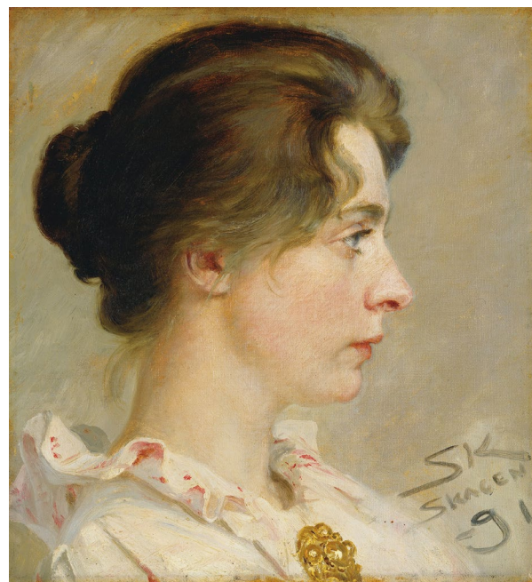
P. S. Krøyer, Marie Krøyer, 1891

entlang des Rückens, so wie waagrechte Maschen, die wie ein Taillenband aussehen. Das Kleid sitzt an der Passe eher eng, danach werden Zunahmen für einen weiten Rock gestrickt.